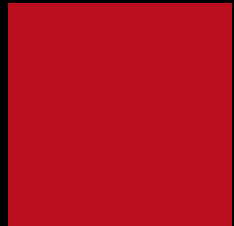
3708011 RED CS 9380011