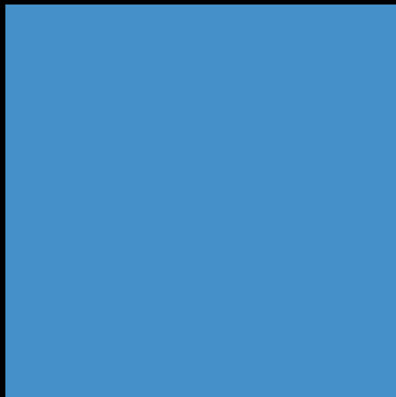
3708017 SKY BLUE CS 9380017 Amostra com espessura 6,5mm.