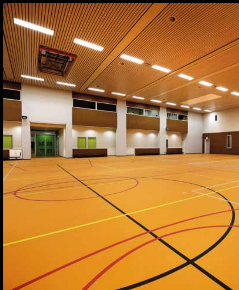
Omnisports® (cor 3708012)

Obs.: verifique as recomendações de aplicação do fabricante da tinta PU bicomponente sobre pot-life após a adição do catalisador.