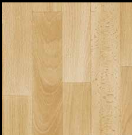
3709001 BEECH CS 9380001