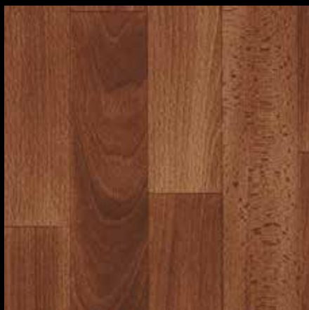
3709004 OAK GUNSTOCK CS 9380004 Amostra com espessura 8,3mm.